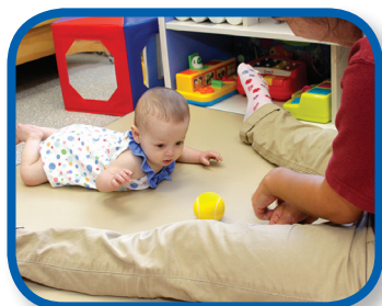
Follow the Ball 2-6 months