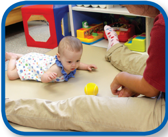
Sigue la pelota De 3 a 6 meses