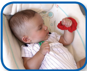
Mira el moño De 3 a 6 meses