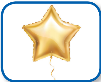
Mira el globo De 3 a 6 meses