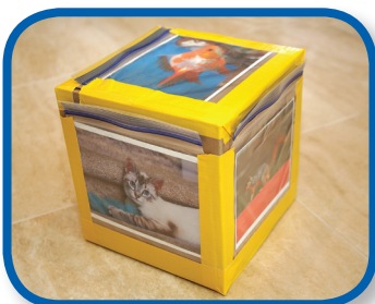
Mira De 4 a 12 meses